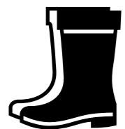
Scarpe di sicurezza