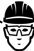
Occhiali di protezione