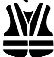
Giubbotto di sicurezza